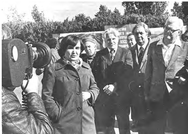
Выездное заседание секретариата Союза писателей в июне 1979 г. в Караваяево

вую очередь гости шли в партокм. Партийный секретарь все стороны жизни коллектива знала досконально. Очень гордилась его людьми. Рассказывая о передовиках, не ограничивалась их высокими показателями в труде, а обязательно подмечала в каждом какой-то свой почерк, интересные черты характера.